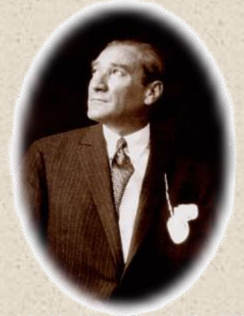
Öğretmenler Yeni Nesil Sizlerin Eseri Olacaktır.

Cumhuriyetin ilanının 95. yılı okulumuzda yapılan etkinliklerle kutlandı. 29 Ekim 1923'te Gazi Mustafa Kemal ATATÜRK öncülüğünde cumhuriyet ilan edildi ve Türk Milleti birçok hakla birlikte kendi geleceğine kendinin karar vermesi hakkına da sahip oldu. Atatürk "Ey yükselen yeni nesil! Cumhuriyeti biz kurduk, onu devam ettirecek sizlersiniz." sözüyle bize cumhuriyeti koruma ve yaşatma görevini vermiştir. Aynı zamanda Ulu Önder Atatürk öğretmenlerin cumhuriyeti koruma